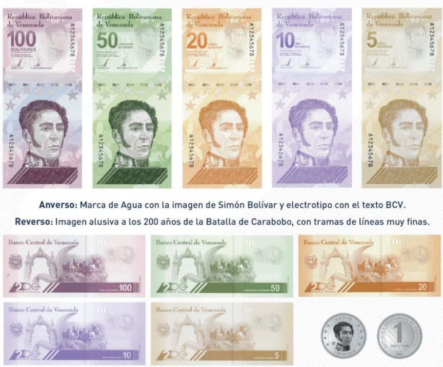
Anverso: Marca de Agua con la imagen de Simón Bolívar y electrotipo con el texto BCV.

Por su parte, según anuncia el Banco Central de Venezuela, el Nuevo Cono Monetario Vigente a partir del 01 de octubre: