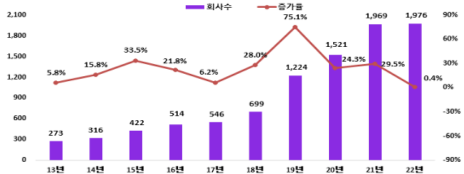
최근 10년간 감사인 지정 현황