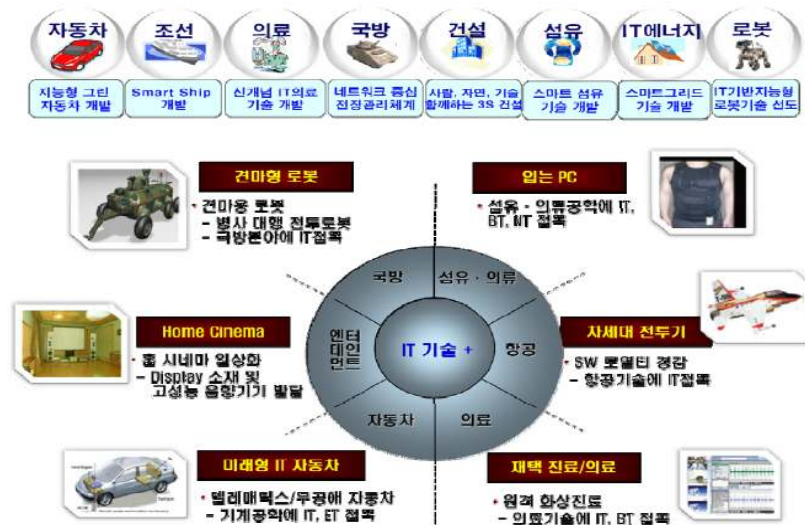
[그림-1] IT기반의 제조 및 서비스의 산업융합 구도