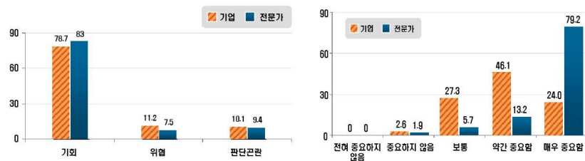
[그림-2] 산업융합의 기회 및 중요성

그러나, 기업/전문가 그룹은 모두 한국산업의 현 위상과 특성 고려시, 산업융합이 한국 산업에 큰 기회임과 동시에 경쟁력 강화요소가 될 것 이라는 데는 공감을 하고 있음.