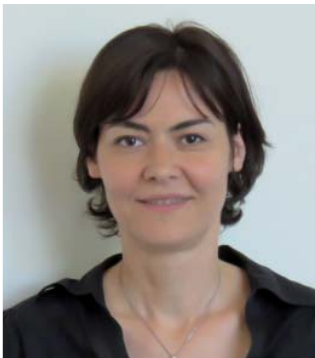
Par Véronique Habé Associée, Crowe Horwath Fiduciaire de Révision (Groupe Fidurévission)

“ Mettre en place une stratégie visant à limiter sa charge d'impôt n'est pas réservé aux multinationales ”