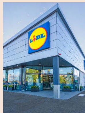
Lidl rota su 'stock' cada semana.

El desembarco digital de Lidl afecta por el momento a sus marcas propias de bazar, que van de la moda a los electrodomésticos, pasando por el hogar y el ocio. Entre ellas figuran la de menaje Silvercrest, la textil Esmara, la deportiva Crivit, la de bricolaje Parkside o la de jardinería Florabest.